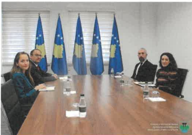
Takimi me Ambasadorin e Austrisë