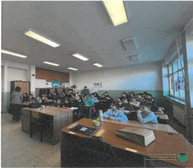
Ligjërata në kuadër të fushatës ndërgjegjësuese për parandalimin e trafikimit me njerëz