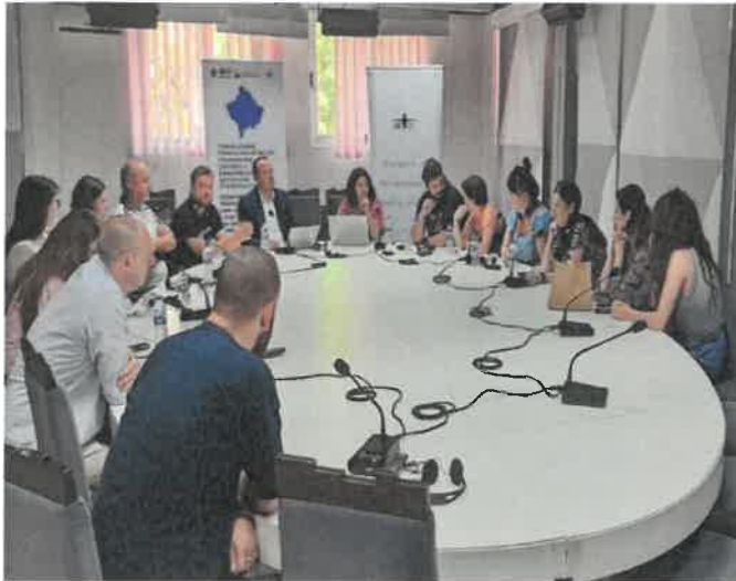
Pjesëmarrja në një diskutim të hapur me temë “Lufta kundër korrupsionit dhe transparenca” në Organiozatën Joqeveritare “ACTIVE”- Veri