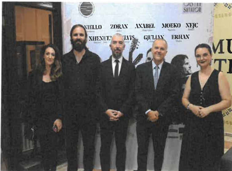
Pjesëmrrje në eventin "Mitrovica Guitar Days"