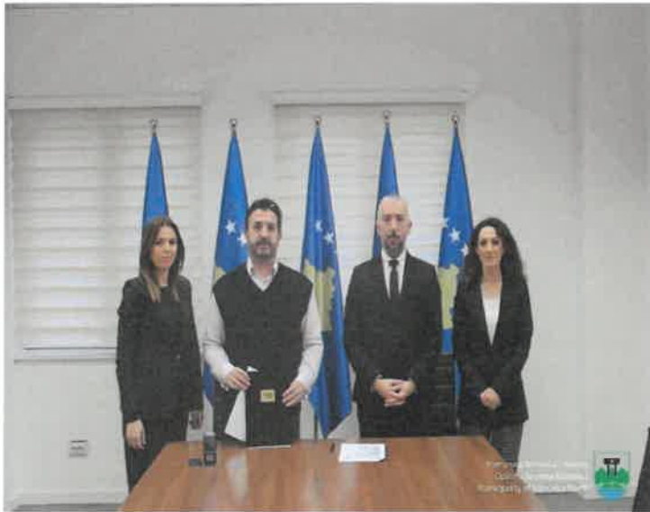
Takimi dhe nënshkrimi i marrëveshjes me drejtorin Ekzekutiv të Insitutit për Ke Krimet e Luftës