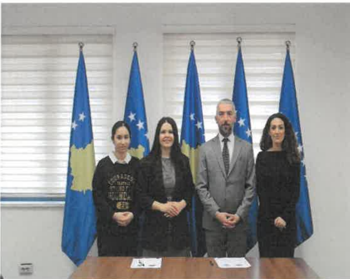
Takimi dhe nënshkrimi i marrëveshjes së bashkëpunimit me YSP-Balkan