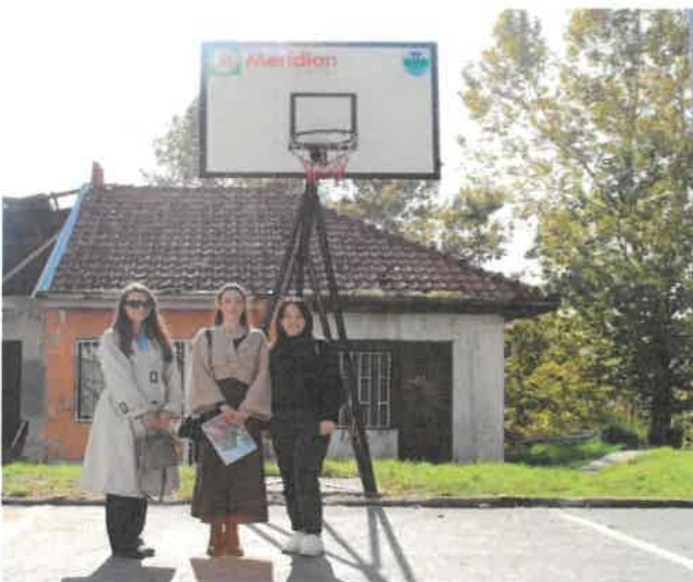
Përrurimi i fushës së basketit i mbështetur nga Kompania "Meridian Express"