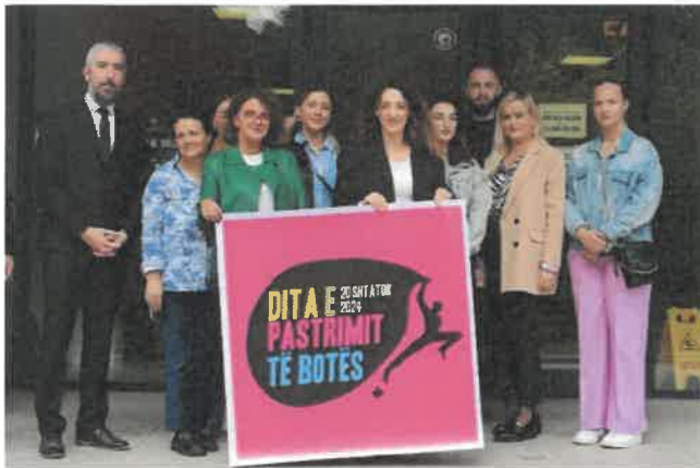
Me rastin e 20 shtatorit, Ditës Botërore të Pastrimit,