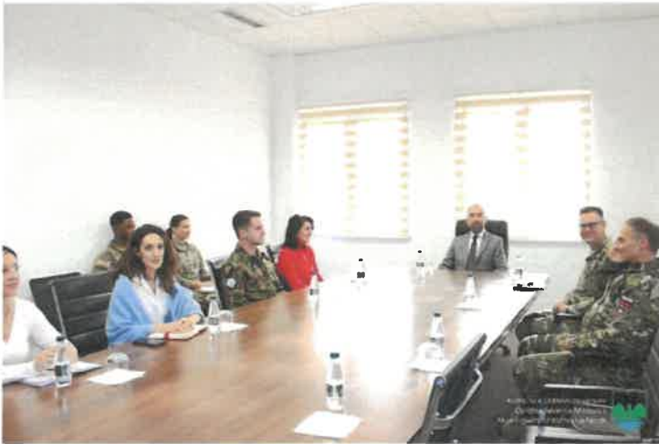
Takimi me përfaqësuesit e KFOR-it