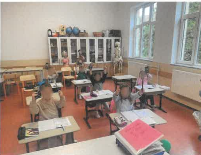
Shërndarja e donacionit të Kompanisë "Interex" në shkollat e Komunës së Veriut