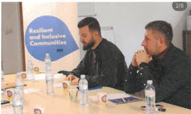
Pjesëmarrja në CBM ku u diskutua për aktivitetet e realizuara gjatë vitit 2024 dhe shtatë planet për vitin 2025.