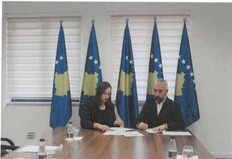
Nënshkrimi i Marrëveshjes me ProCredit Bank